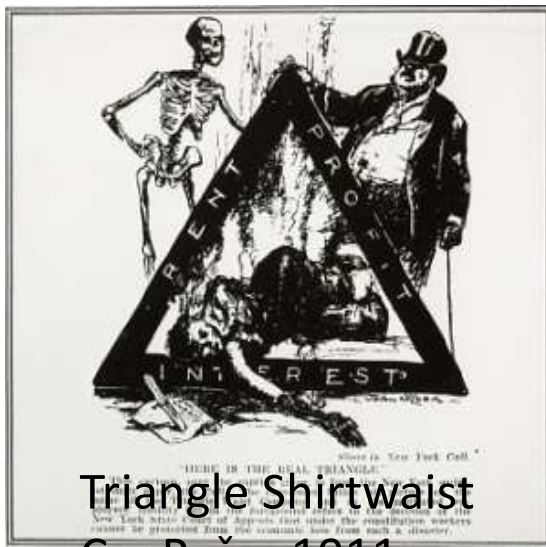
Triangle Shirtwaist Co. Dečak 1911