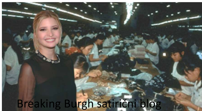
Breaking Burgh satirični blog