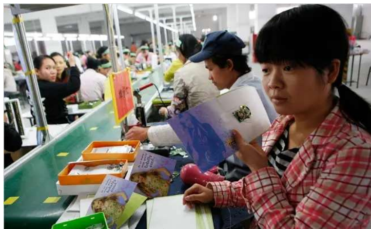
Adorable! Ivanka Trump Reunited With Long-Lost Sweatshop While On Asia Trip