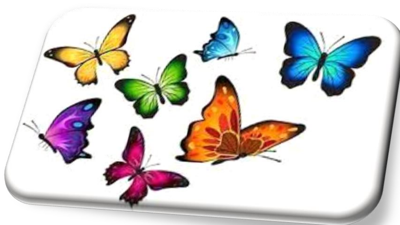
Slika 4: Leptiri 3

Da bi se pravovremeno uočile promjene u zastupljenosti leptira, u mnogim se dijelovima svijeta njihova rasprostranjenost prati na kartama. Karte su dobra osnova za praćenje promjena u njihovom broju i rasprostranjenosti tijekom godina. Na takav se način može provjeriti i na vrijeme usporiti svaka ozbiljna promjena. 1