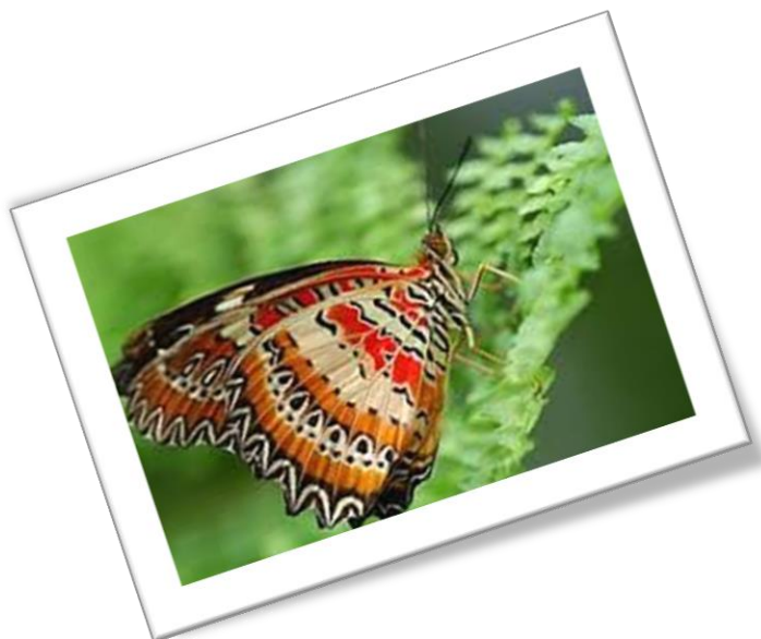
Slika 2: Leptir 2

Smotano dugo sisalo, smješteno s donje strane glave, leptiri mogu ispružiti. Koriste ga pri hranjenju. Hrane se biljnim sokovima koje sišu. Najveći dio njihove hrane čini nektar, uglavnom sakriven duboko u cvijetu.