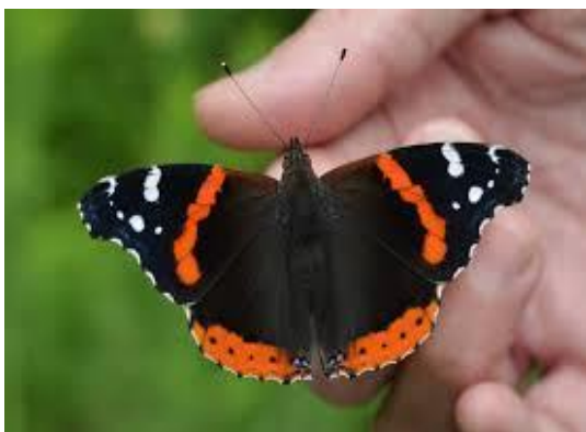
Slika 1: Leptir 1

Leptire nalazimo u gotovo svim dijelovima svijeta, izuzev Sjevernog i Južnog pola, a tijekom ljeta može ih se pronaći čak i na Arktiku. Leptiri su češći u tropskim krajevima nego u Sjevernoj Americi i Europi gdje nastanjuju najraznolikija staništa. Neki žive visoko u planinama, drugi na oceanskim otocima, a neki dio svog života provode u slatkim vodama.